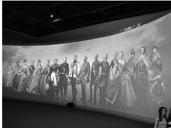
РИСУНОК 9. Вереница царей на исторических выставках в Манеже

ветской армии, потерявшей из-за бездарности командования огромное число бойцов, посланных на верную гибель. И изображение Ржевского мемориала появилось на стене дома только по воле лстивых царедворцев, так как монумент понравился президенту Владимиру Путину, принявшему вместе с президентом Беларуси Александром Лукашенко участие в его торжественном открытии 30 июня 2020 года. Тем не менее в глазах досужего и не слишком образованного зрителя весь этот комплекс воспринимается в тер-